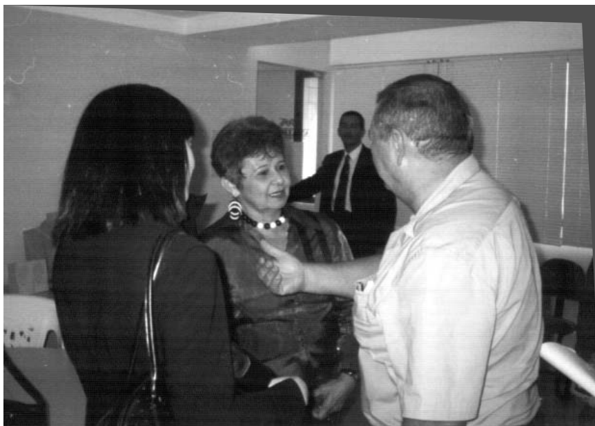
Encontro com a presidência eleita do TRT 21: AMATRA 21 promove reunião de trabalho entre Juízes e presidenta, vice-presidente e ouvidor-geral do TRT 21.