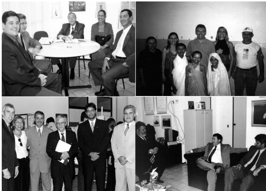
Visitas institucionais, projeto social, promoção de eventos regionais: AMATRA 21 diversificou as atividades e democratizou a atuação

tratura Trabalhista da 21ª Região e das carreiras jurídicas do Rio Grande do Norte. Através da ESMAT 21, foram promovidos diversos eventos regionais, seminários, encontros, cursos e adquiridos títulos para aumentar o acervo da Biblioteca e da Videoteca da Escola.