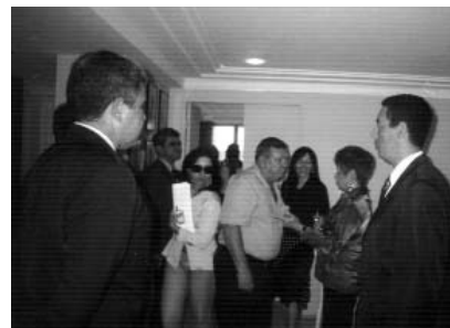
Encontro com a presidência do TRT 21 ocorreu na sede da AMATRA 21, em Natal

Outra conquista do movimento associativo dos Juízes do Trabalho é relativa à publicação de sentenças no Diário Oficial do Estado. O procedimento dá maior transparência às decisões judiciais, além de celeridade e de economia processuais à Justiça Trabalhista, facilitando também a ação de advogados, Magistrados e do jurisdicionado em geral. O Provimento TRT CR nº 04/2004 foi Publicado no Diário Oficial do Estado no último dia 10 de julho.