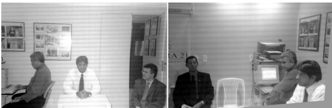
Assembléia Geral homologa o resultado da eleição e dá posse à chapa reeleita.